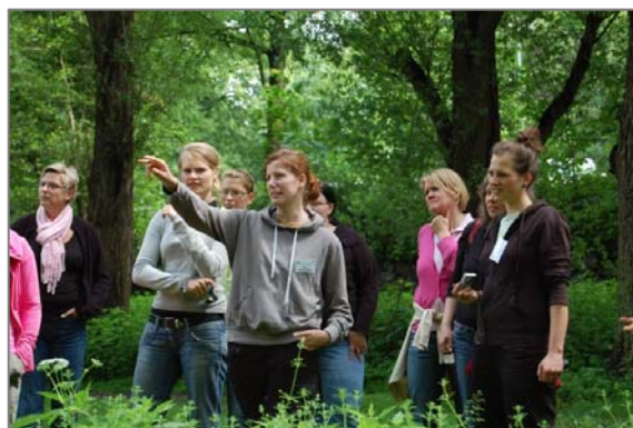
Fachtagung „Den Norden erleben!“ 11.06.10